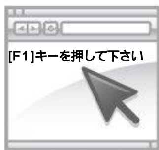
[F1]キーを押す様にメッセージが表示される